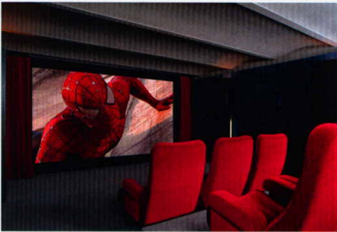
Willkommen in „Europas bestem Heimkino“ – die Besucher erwarten Kinoatmosphäre und perfekter Sound

Mit den hochwertigen, im Schwarzwald gefertigten Revox Lautsprechern tauchen die Besucher in ungeahnte Klangwelten ein. Für jedes Ambiente und Zuhause findet sich die optimale Lösung: Es gibt elegante Revox Lautsprecher, die mit echtem Leder verkleidet sind, passend zum Sofa, außerdem Varianten mit Echtglasfront, unterschiedlichste Größen und Einbauvarianten in Wand und Decke.