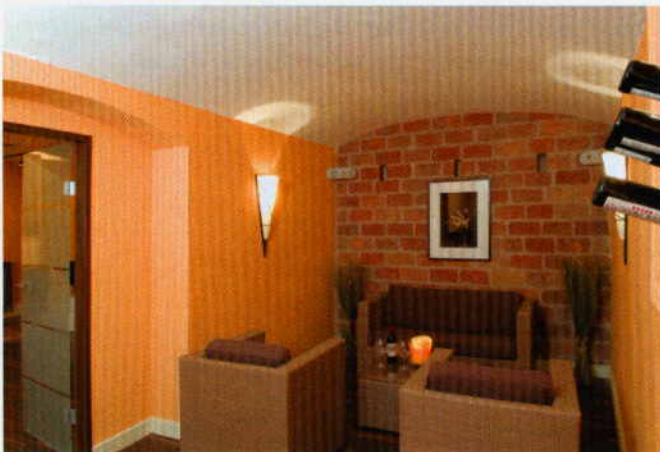
Wie dezent sich Home Entertainment und Haustechnik integrieren lassen, sehen die Besucher in den realistischen Wohnszenen, selbst ein Weinkeller ist angelegt

Vernetzt ist das Gira Revox Studio via KNX/EIB System, der Gira HomeServer dient als Gehirn des Netzwerks. Vor Ort können die Kunden ausprobieren, wie einfach sich die Technik über das Gira Interface bedienen lässt. So können unter anderem verschiedene Lichtszenen geschaltet und Jalousien betätigt oder der Energieverbrauch gemessen, dargestellt und verglichen werden. Ideal ist, dass sich das Revox Multiroom-System vollständig in die moderne Elektroinstallation von Gira integrieren lässt. <