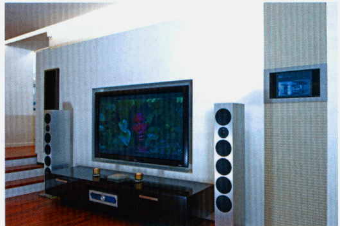
Das Gehirn hinter der intelligenten Haustechnik ist der Gira HomeServer, bedient wird unter anderem über Gira Touchdisplays mit intuitiver Nutzerführung über das Gira Interface