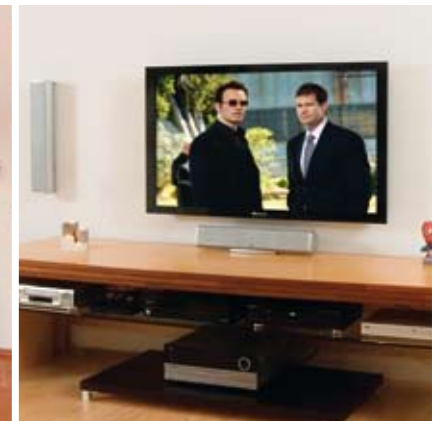
Moderne Homecinema-Lösungen haben nicht nur puncto Bildqualität die Nase vorn, sondern lassen sich auch gut in jedes moderne Wohnambiente integrieren.

liert, gehören dank anamorpher Optik und einer ausgeklügelten Elektronik der Vergangenheit an. Durch updatefähige Digital Controller ist das Homecinema System immer am letzten Stand der Technik und somit ist auch der Werterhalt der Anlage sicher gestellt.