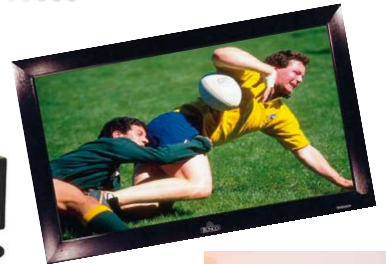
Real-Live-Effekt: Homecinema-System von Runco

Echte Größe besitzt nur ein Homecinema System mit Projektor: Licht dimmen, Leinwand runterfahren und Film ab!